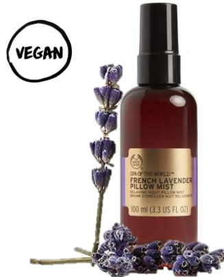
＜リネン用スプレー＞ フレンチ ラベンダーピローミスト 100mL 2,400円(税抜) 2,640円(税込)

生活に溶け込むようなシックなデザインボトル。目を閉じて深呼吸をすると、まるでフランスのラベンダーの野原が浮かびそうなやわらかい香りは、自分だけでなく、誰かにお勧めたくなるような上質な香り。自宅はもちろん、旅先や出張先で、一吹きするだけで日常を忘れるような、おだやかで心地よい眠りに導きます。