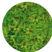
ティーツリーオイル (芳香成分) *コミュニティレード原料

フレッシュな葉だけを厳選し、手摘み後12時間以内に水蒸気蒸留した純度の高いティーツリーオイルをベースに、爽やかな香りのレモンティーツリーオイルと古くから美容オイルとして用いられてきたタマヌオイルをブレンド。過剰な皮脂による肌トラブルに働きかけます。