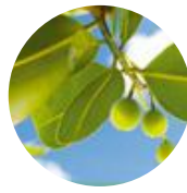
タマヌオイル (保湿成分)